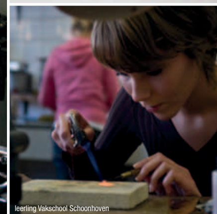
leerling Vakschool Schoonhoven